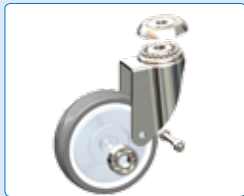
doppelt kugelgelagerte 125 mm Rollen