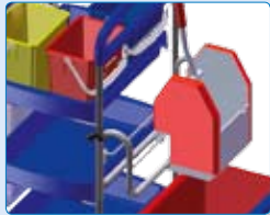
alle Modelle auch mit Vertikalpresse erhältlich

Verfahren auch in niedriger budgetierten Objekten erlaubt.