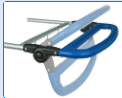
Clino® ErgoGrip (auf Wunsch höhenverstellbar)