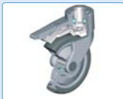
doppelt kugelgelagerte 125 mm Rollen mit Verkleidung